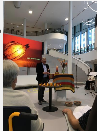
'Licht dat verder gaat'

Al was het een hele toer om het allemaal weer voor elkaar te krijgen na zo lange tijd, het samenzijn zelf inspireerde me. Hier doen we het voor, wist ik weer: patiënten in de kwetsbare situatie van hun opname even iets anders bieden, een moment en een plaats om op verhaal te komen, door muziek en tekst en in ontmoeting met anderen. Het was fijn om te merken dat een dergelijk aanbod op zondag nog altijd aansluit bij wens en verlangens van patiënten en hun naasten.