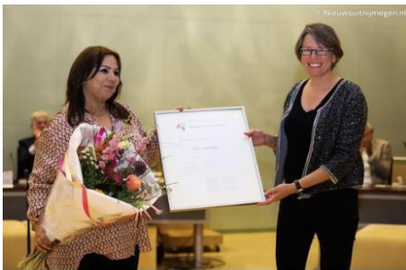
Uit: De Brug Nijmegen 14 juni 2022