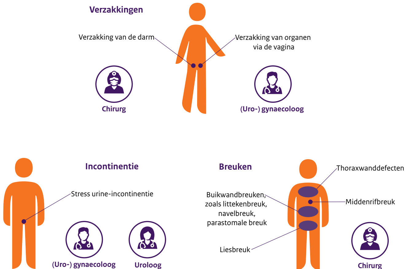
Figuur 1. Aandoeningen waarvoor mesh-implantaten worden gebruikt. De locaties daarvan in het lichaam en welke artsen ze plaatsen.

Er zijn verschillende aandoeningen waarbij verzwakte weefsels verstevigd kunnen worden met een mesh-implantaat. Zoals bij een liesbreuk of wanneer de baarmoeder is verzakt. In figuur 1 staan de aandoeningen waarvoor mesh-implantaten worden gebruikt. Daar ziet u ook welke soort artsen het implantaat plaatsen.