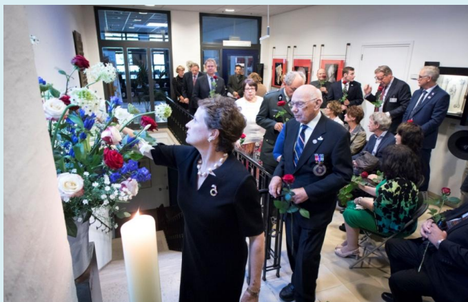
Ritueel bij de herdenkingsplaquette